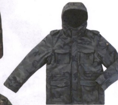
ARMATA DI MARE