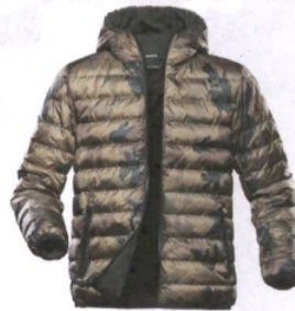
PEOPLE OF SHIBUYA