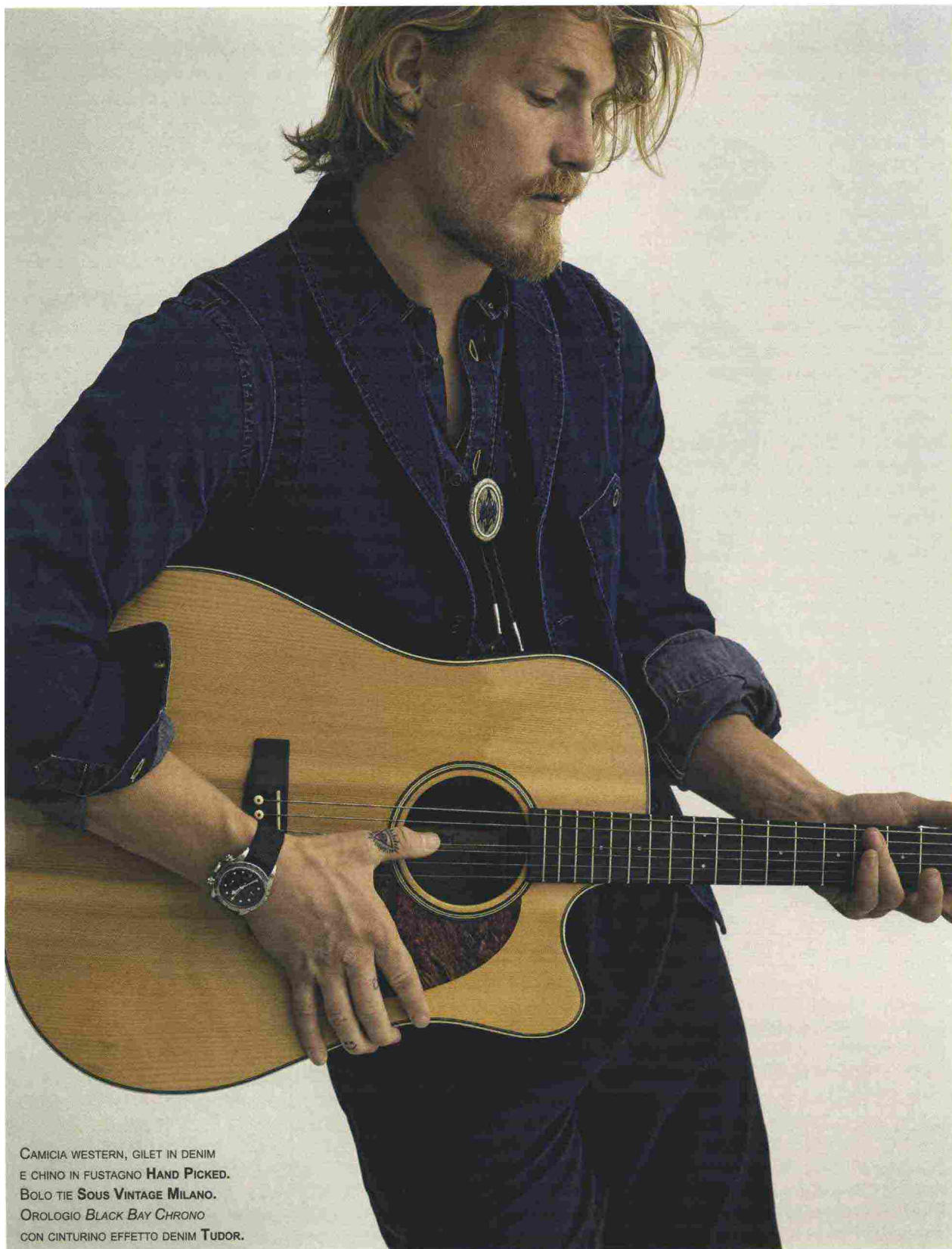
CAMICIA WESTERN, GILET IN DENIM E CHINO IN FUSTAGNO HAND PICKED . BOLO TIE SOUS VINTAGE MILANO . OROLOGIO BLACK BAY CHRONO CON CINTURINO EFFETTO DENIM TUDOR .