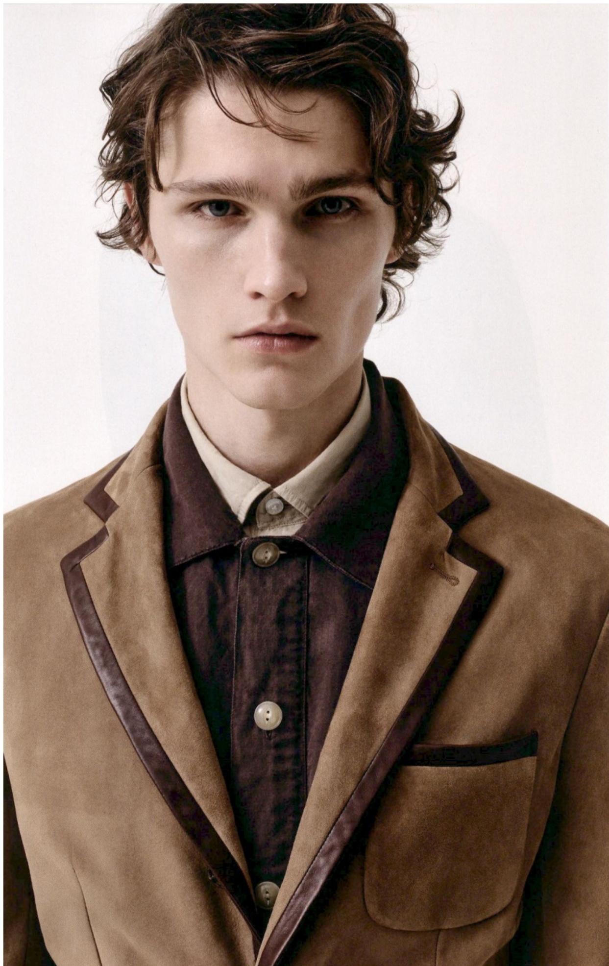
SUEDE Giacca e camicia beige TOD'S , camicia marrone HAND PICKED